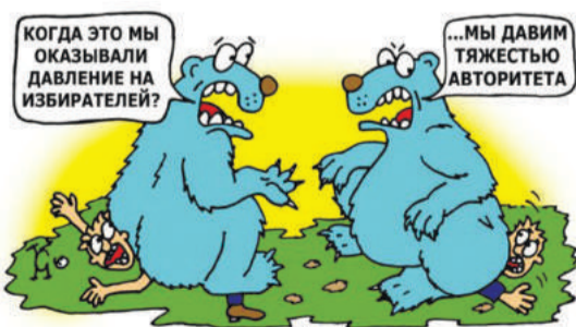
Их методы агитации