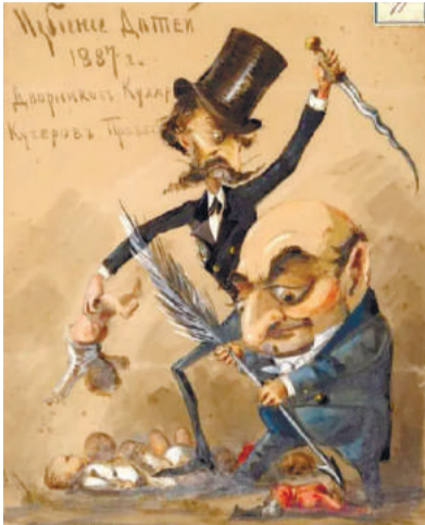
Избиение детей дворников, кухарок, кучеров, прачек. Карикатура Ивана Всеволодского, 1887 г.

3. Внутренняя политика не решила коренных проблем в жизни рабочих и крестьян. Принятые меры по переселению крестьян оказались недостаточными для решения