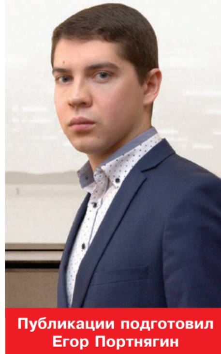
Публикации подготовил Егор Портнягин

12 сентября 2015 года, в аккурат, накануне избрания губернатора, в Петропавловске-Камчатском неожиданно случился День города. Почему случился? Вообще-то, день нашего города — 17 октября.