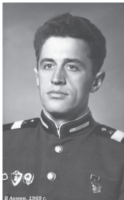
В Армии, 1969 г.