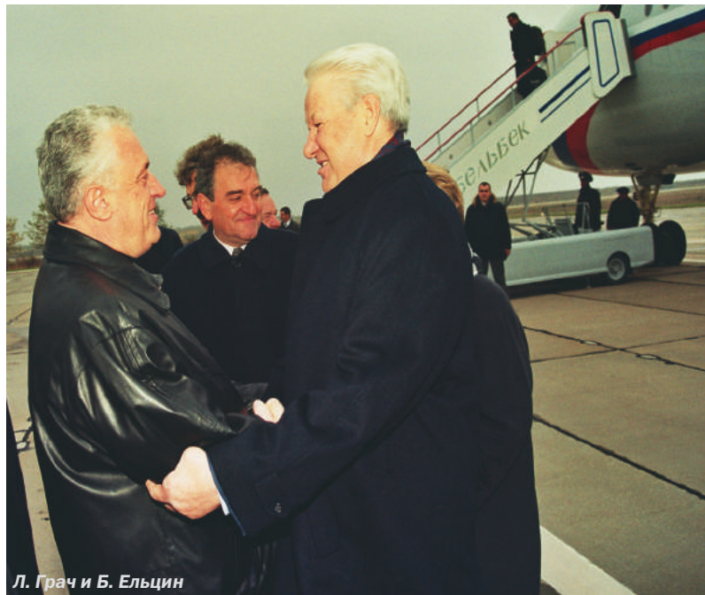
Л. Грач и Б. Ельцин