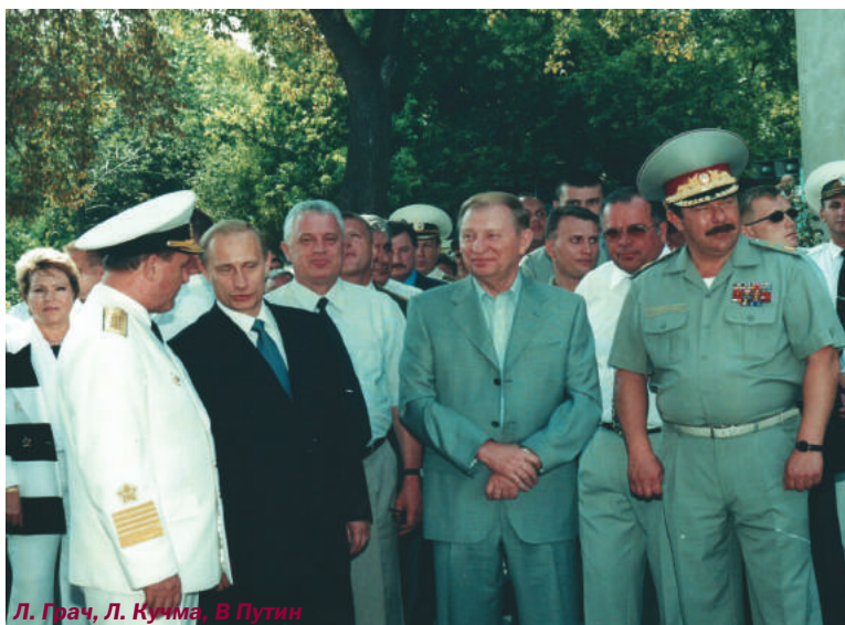
Л. Грач, Л. Кучма, В. Путин