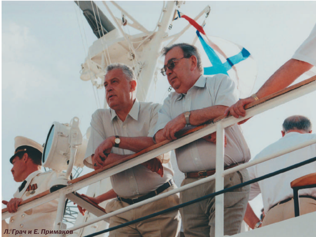
Л. Грач и Е. Примаков