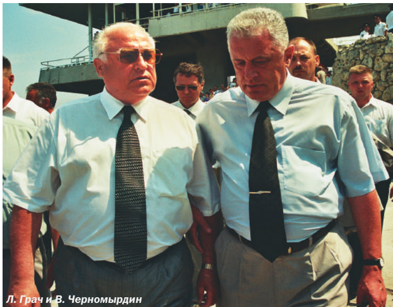
Л. Грач и В. Черномырдин