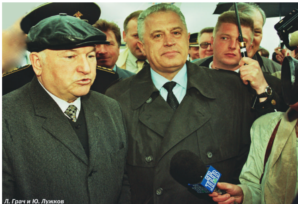
Л. Грач и Ю. Лужков